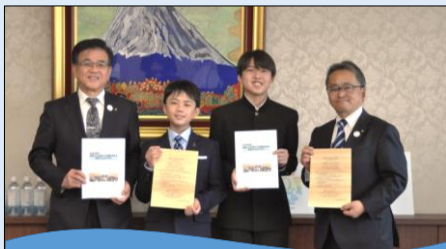
未来づくり宣言手交式より

https://www.city.hadano.kanagawa.jp/www/content/s/1743053116822/index.html