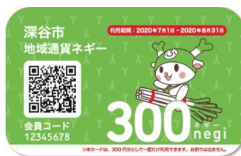
埼玉県深谷市 「地域通貨ネギー」