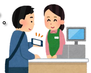
入力内容を店舗に確認 してもらい支払完了