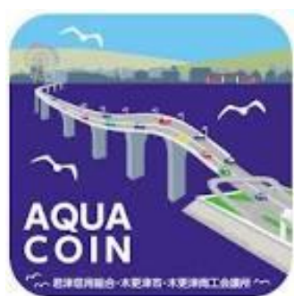
千葉県木更津市 「アクアコイン」