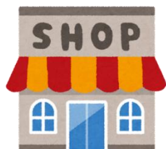
お店で品物を購入