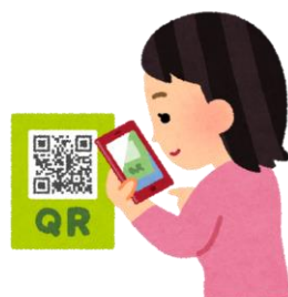
専用アプリでお店の QRを読み取る