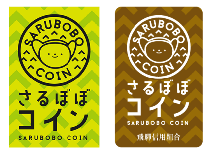
岐阜県高山市 「さるぼぼコイン」