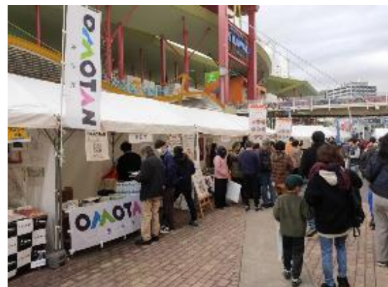
おだきゅう Family Fun フェスタ