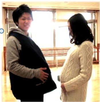
妊婦体験 (イメージ)