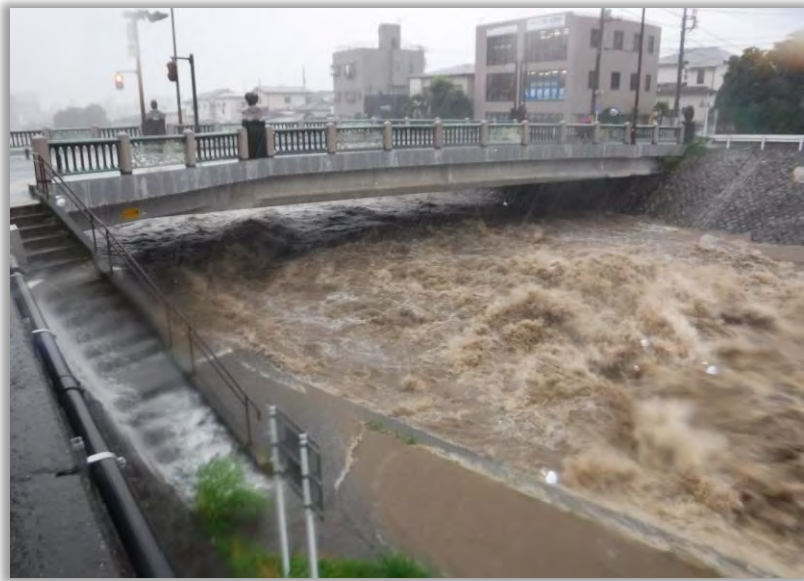
(R3.7.3_本庁舎前桜橋(水無川)のようす)