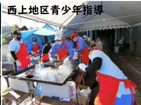
西上地区青少年指導