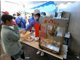
にこにこパン工房