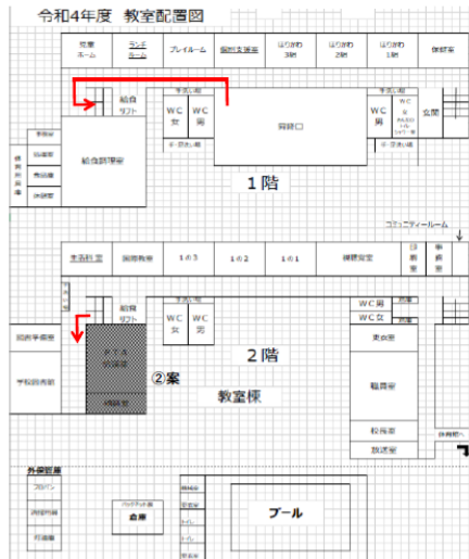
【2案】PTA会議室・相談室