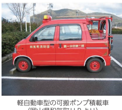
軽自動車型の可搬ポンプ積載車(岡山県和気町HPより)

答 紹介のあったアプリは、食品ロス削減の効果とともに、食品関連事業者と消費者をつなぐデジタルならではの強みを生かした効果が得が必要となるなどの課題がある。環境性能の高い軽自動車型の車両を導入し、入団促進の広報に加え、女性団員の拡充につなげてほしい。