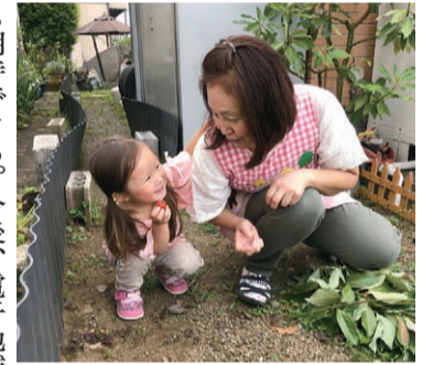
安心して子育てができる環境の整備を