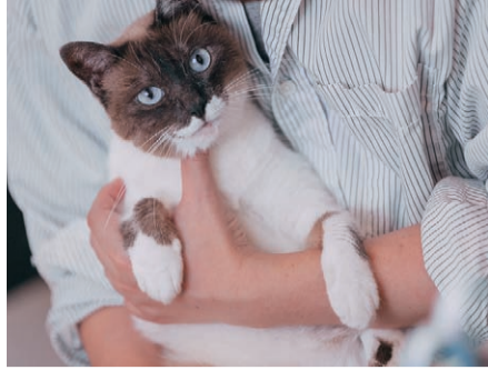
ペットと共生できる社会のための支援を

答 管理職や養護教諭が付き添い、個別に対応することに加え、現地の医療機関などを受診し、医師の診断や指示に従っている。また、修学旅行は日本スポーツ振興セン