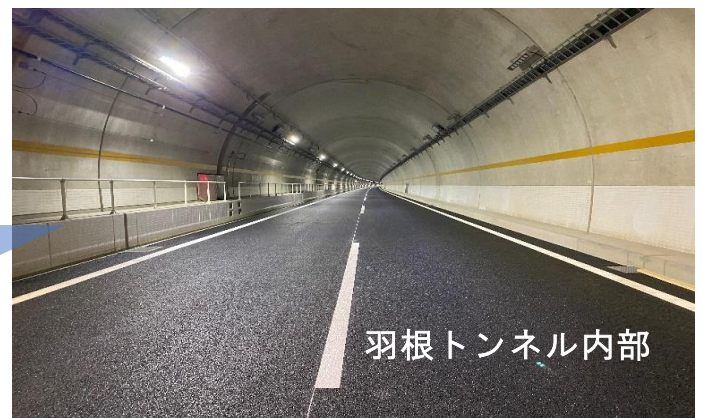
羽根トンネル内部