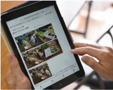
人に優しいデジタル化を(試行運用されている自治会SNS「いちのいち」)