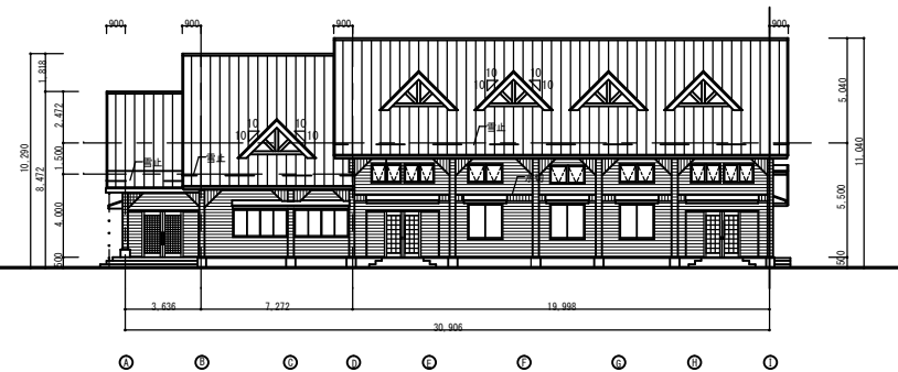
南側立面図 S = 1 : 200