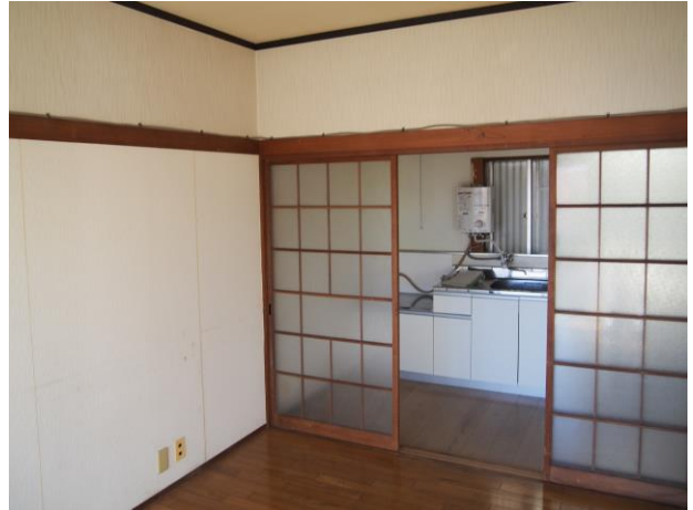
洋室 1 (写真 2)