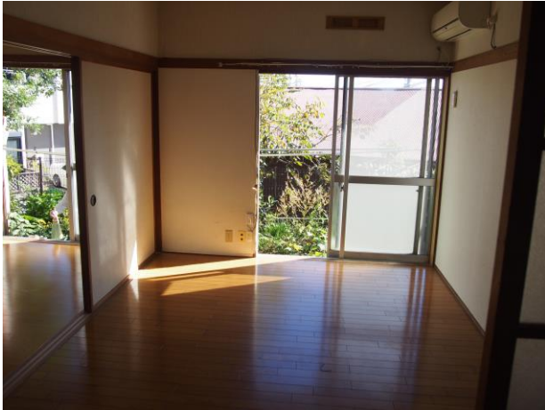
洋室 1 (写真 1)