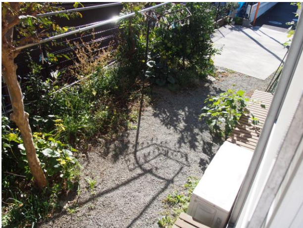
庭 (写真 1)