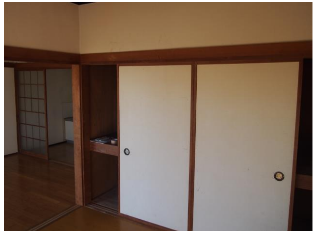
洋室 2 (写真 2)