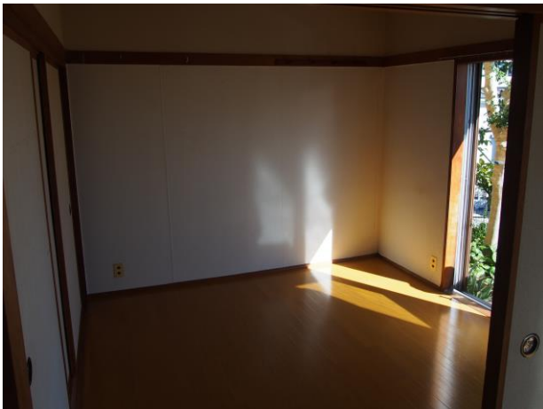
洋室 2 (写真 1)