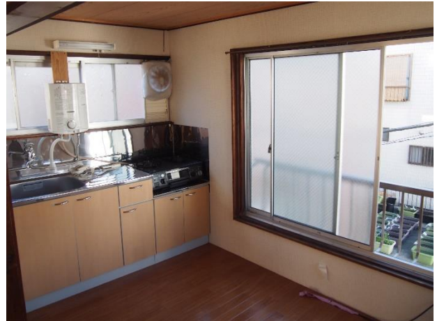
ダイニングキッチン1