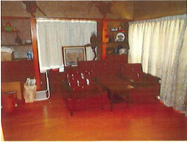
洋室 (部屋 1)