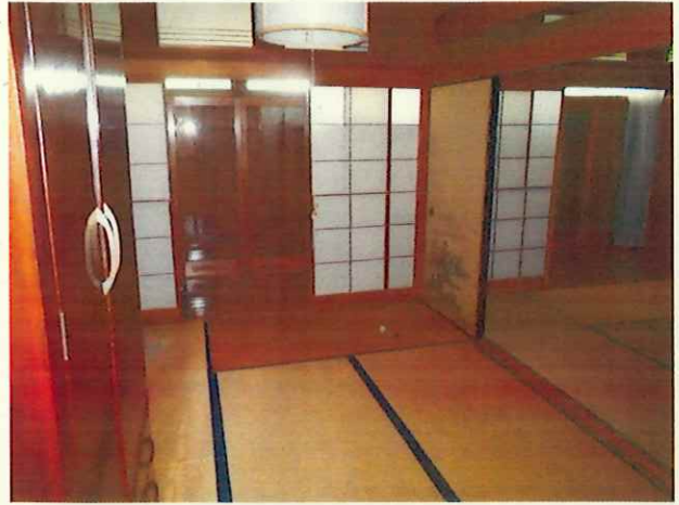
和室 (部屋 2)