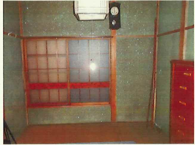
和室 (部屋 4)