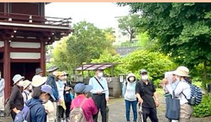
(↑) 昨年実施した時の様子