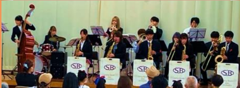
△ 昨年出演し、進行から舞台回しまで活躍された東海大学ジャズ研究会の皆さん