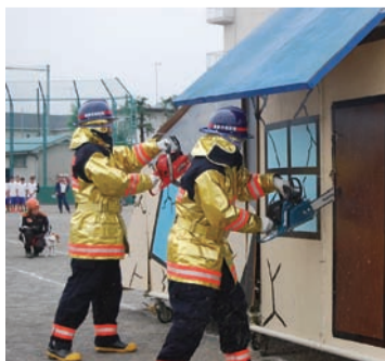
訓練を行う消防団員