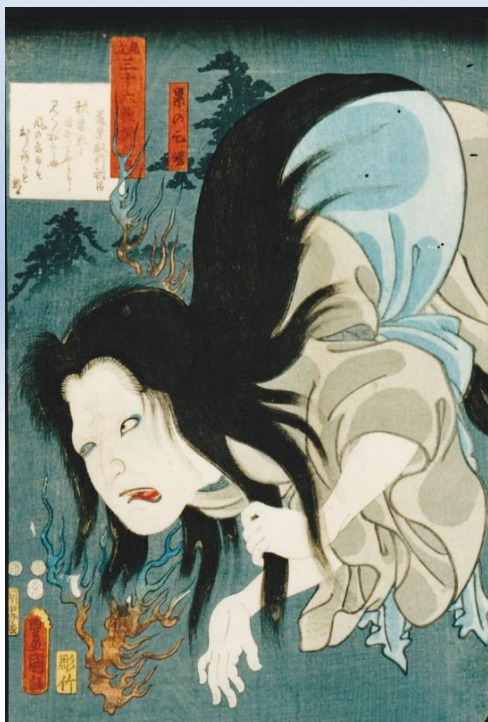
三代歌川豊国 見立三十六歌撰之内 藤原敏行朝臣 累の亡魂