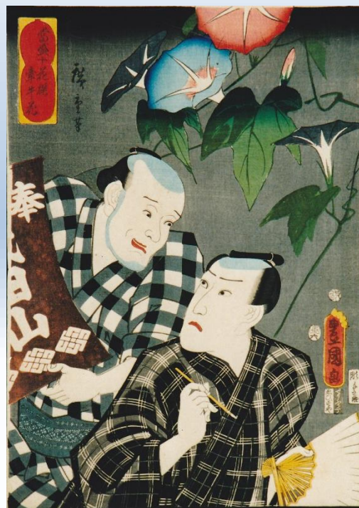
三代歌川豊国・歌川広重 当盛十花撰 牽牛花