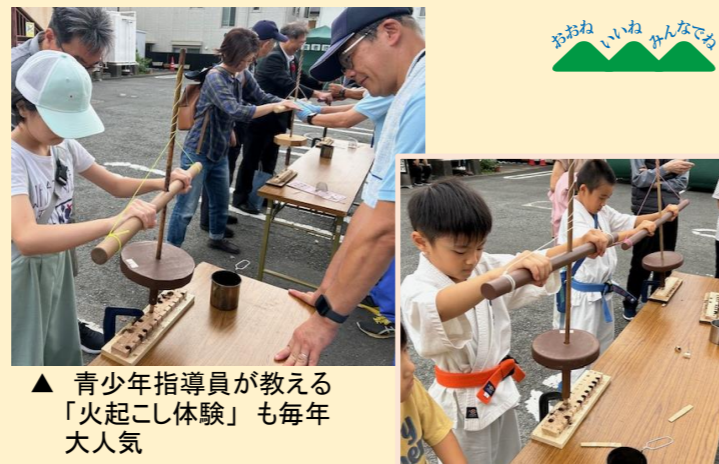
▲ 青少年指導員が教える「火起こし体験」も毎年大人気