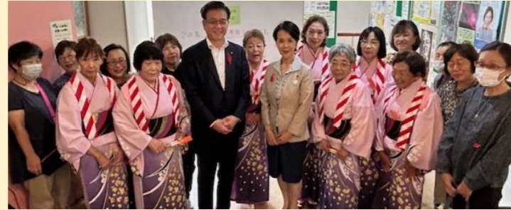
▲ 初参加の「瓜生野盆踊り保存会」の皆さんが市長・議長と

そのほんの一部を写真で紹介。紙面の都合で載っていない団体の皆さん、ご容赦ください。出展・出演者をはじめ、お力添えいただいた皆様、誠にありがとうございました。