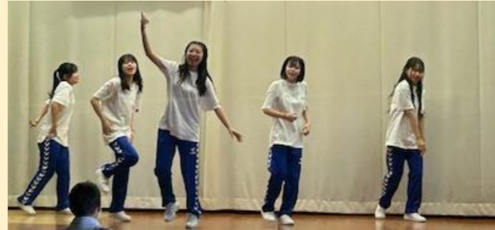
▲ 若さあふれるパフォーマンス「秦野高校ストリートダンス部」