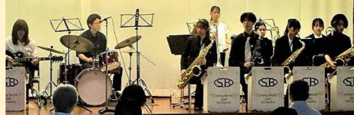
▲ 司会、運営も担った「東海大学ジャズ研究会」の演奏