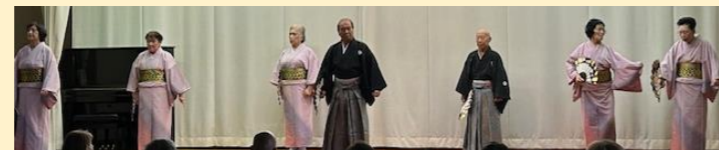
▲ さすが長年の芸が光る「秦野白ゆり教室」の舞踊