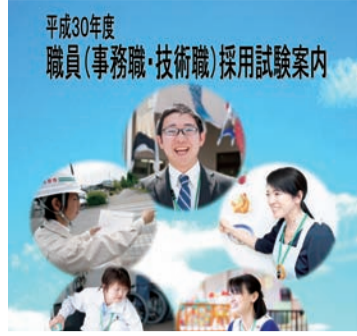
人物重視の採用を

要望 管理栄養士など専門職の採用における社会人の応募者については、有資格者であることなどから、一般教養試験を重視するのではなく、人物重視の採用方法にす