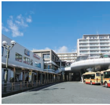
地域の魅力を生かしたにぎわいの創出を