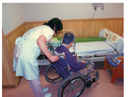
介護現場の労働環境改善を