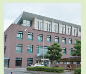
平沢にある 秦野商工会議所

終戦間もない昭和23年、産業や経済が混乱する中、地域の活性化のため団結した309の商工業者によって設立。平成7年には市西商工会と合併し、市全域の経営者を支える組織として地元商工業者の発展を支援しています。70年の節目を迎えた今、会員同士の交流懇談会を開催するなど、新しい取り組みもしています。