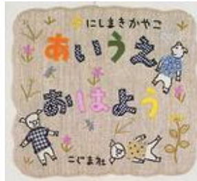
2003年 こぐま社 にしまき かやこ作・絵