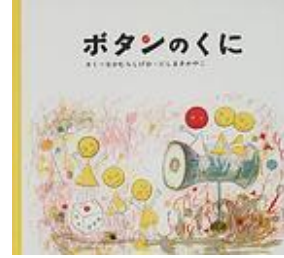
1975年 こぐま社 にしまき かやこ絵 なかむらしげお作