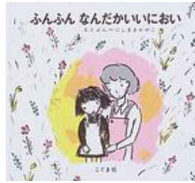
1977年 こぐま社 にしまき かやこ作・絵