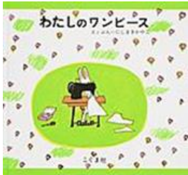
1969年 こぐま社 にしまき かやこ作・絵