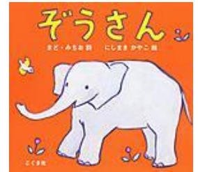
1975年 こぐま社 にしまき かやこ絵 まど みちお詩