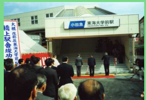
昭和62年東海大学前駅 駅舎竣工