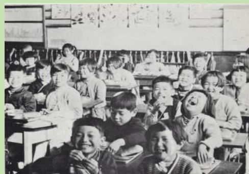
昭和36年西小学校給食の様子