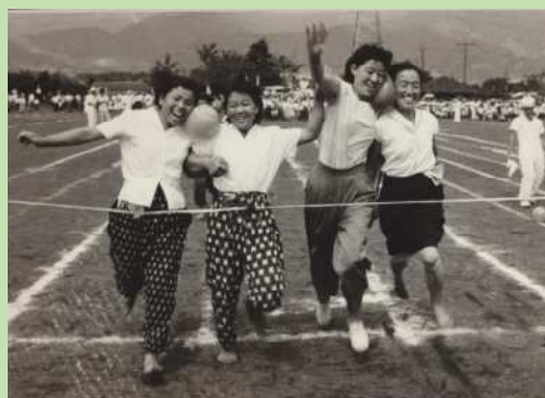
昭和37年西秦野町民大会