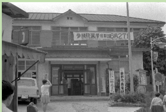
昭和46年西秦野町役場