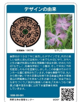
【秦野市のマンホールカード】