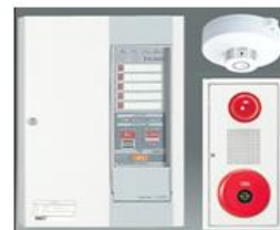
自動火災報知設備