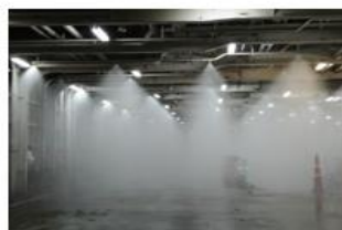
スプリンクラー設備