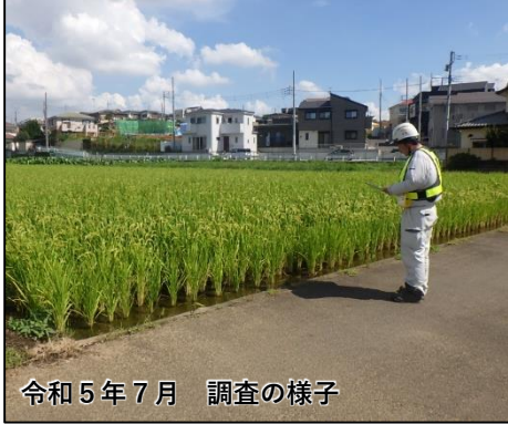
令和5年7月 調査の様子

田畑を潤すために必要なかんがい用水について、本年7～8月に水路系統の詳細確認、あわせて河川や湧水箇所などを確認するための現地踏査を実施しました。