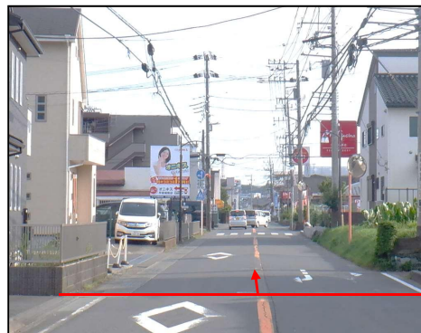
終点(落幡バス停付近)