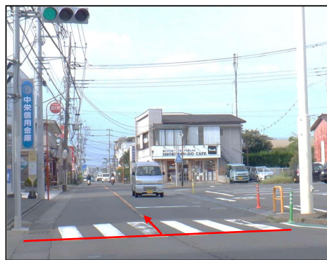
起点(サンライフ入口交差点)