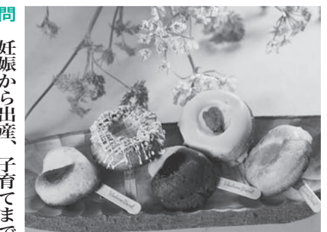
ふるさと寄付金返礼品の一つ「はだのドーナツ」

答 若者が多い東海大学前駅の連絡所に期日前投票所を増設したいと考えている。選挙当日の共通投票所の設置については、法改正の動きなどの情報収集に努めたい。