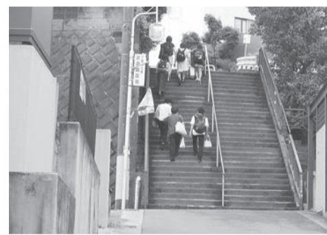
エスカレーターが設置される急階段

答 第60回の節目に当たり、祭りを盛況に開催するため検討委員会を議論を重ねた。子供大名行列は参加者の減少や費用などを考慮し廃止との結論に至った。委員会の結論を尊重したいと考えている。