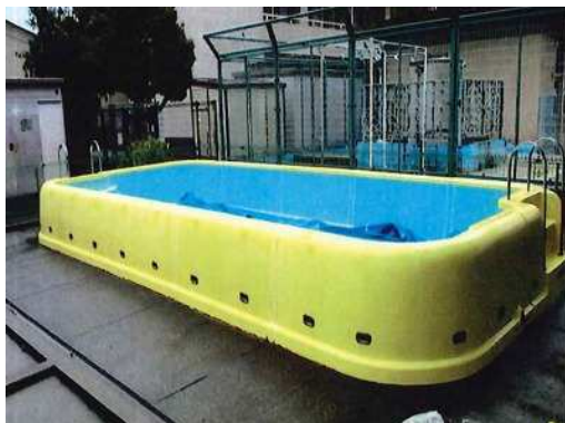
つるまき 及び ひろはたこども園 プール修繕