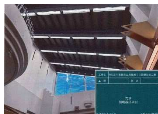
鶴巻公民館ガラス屋根改修工事