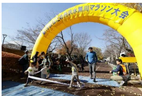
みなせマラソン（まめっこ）