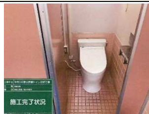
公民館トイレ改修工事