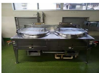
ガス丸形フライヤー