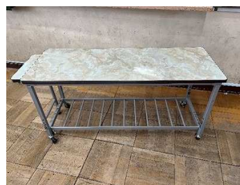
スチール折畳式配膳台