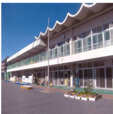
公立認定こども園施設改修 みどりこども園ベランダ等塗装工事