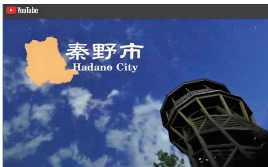
秦野市公式 YouTube より 「秦野の魅力『総合編』」

※2 パブリシティ・・・行政機関や団体、企業などが、その事業や製品に関する情報を報道機関に提供し、マスメディアで報道されるように働きかける広報活動