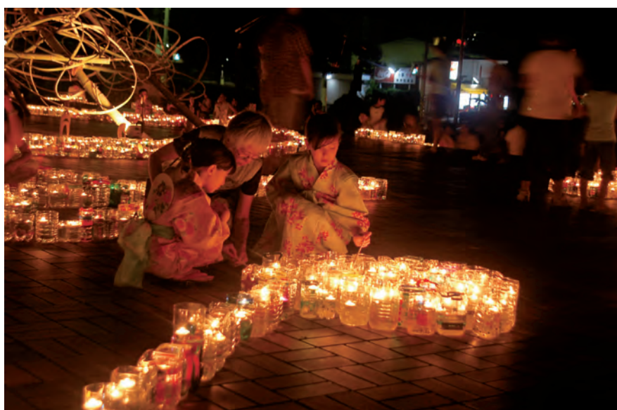
ピースキャンドルナイト