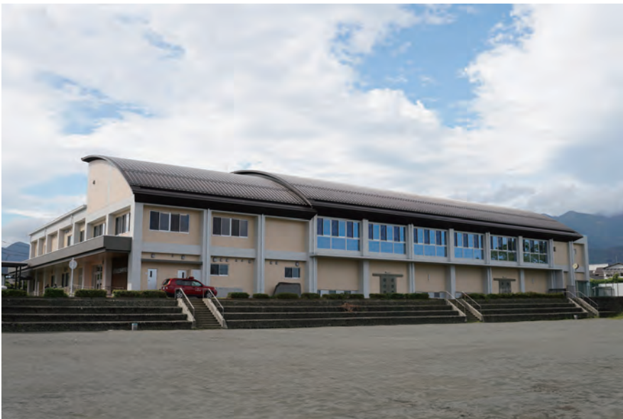
西中学校多機能型体育館