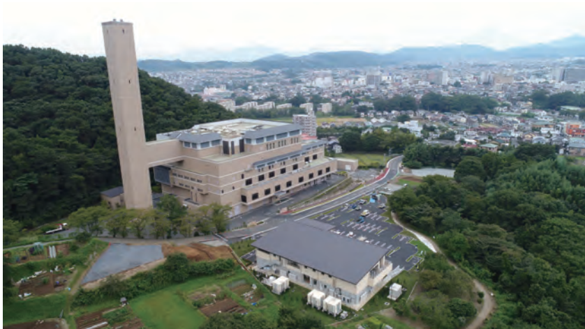
はだのクリーンセンター (写真中央)