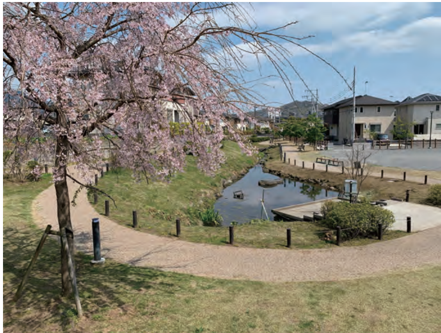
今泉あらい湧水公園

※1 「コンパクト・プラス・ネットワーク」型都市構造・・・都市の中心部や地域の拠点に医療・福祉・商業等の生活に必要な機能を集約し、公共交通のネットワーク形成によりその拠点間の連携を図ることで、あらゆる世代が安心・快適に暮らせる都市構造