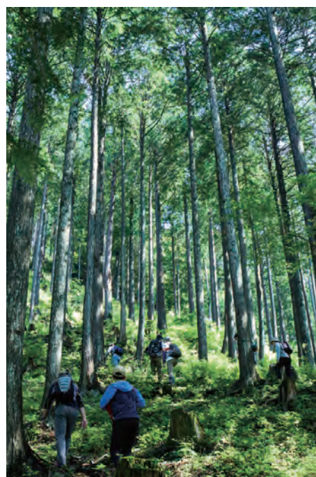
市民共有の財産である森林