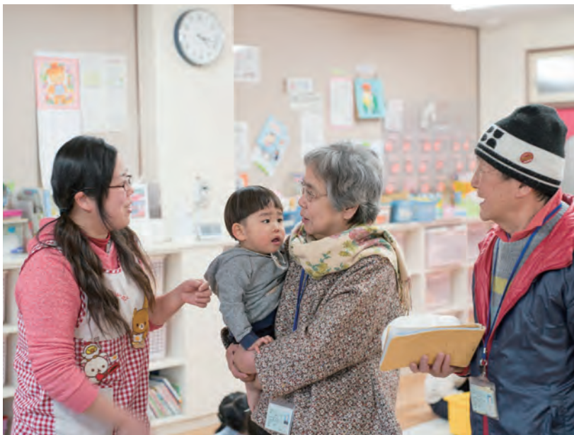
保育所への送迎をするファミリー・サポート・センターの支援会員