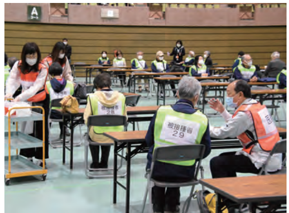
新型コロナウイルスワクチン集団接種訓練の様子