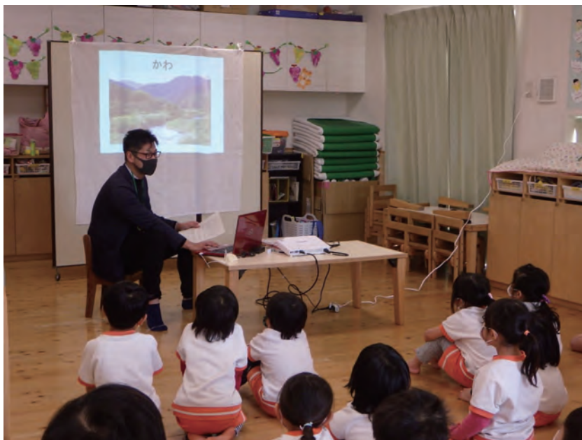
はだのエコスクール

※1 交通需要マネジメント(TDM)・・・自動車利用者に様々な方法で交通行動の変更を促すことにより、都心や地域レベルで道路交通混雑を緩和する方法