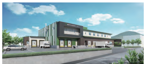
学校給食センター完成イメージ図