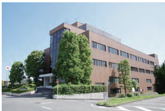
浄水管理センター