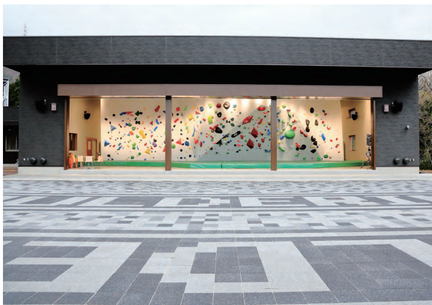
はだの丹沢クライミングパーク