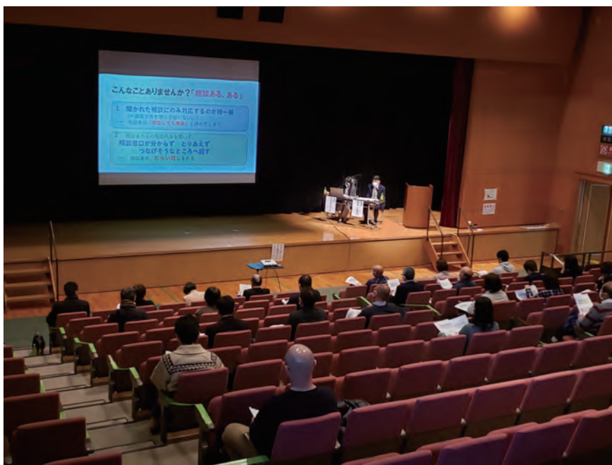
地域共生社会に関する研修会の様子

※1 8050問題・・・80代の親が50代の子どもの生活を支え、こうした親子が社会から孤立する問題