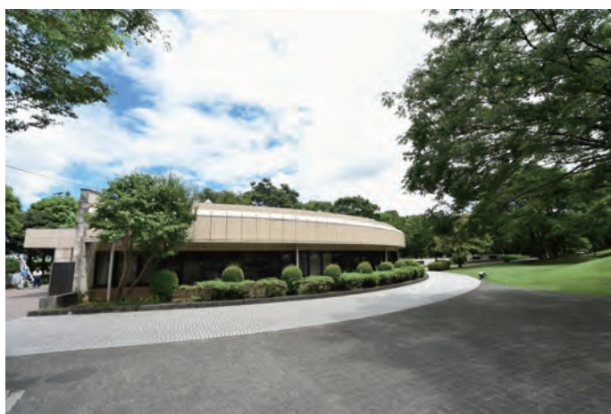
はだの歴史博物館