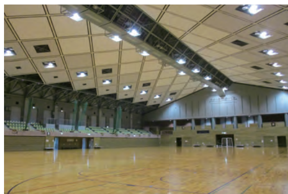
総合体育館メインアリーナ