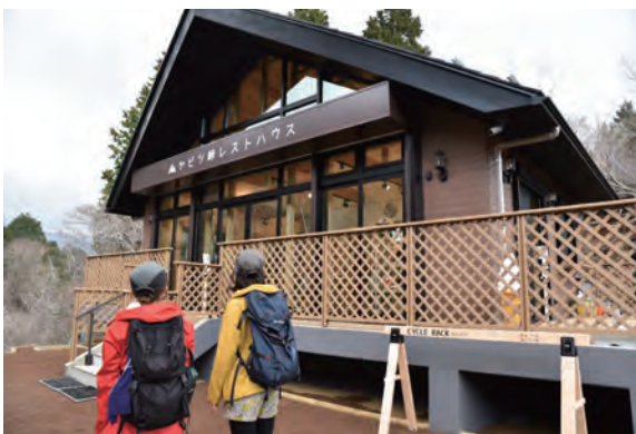
ヤビツ峠レストハウス