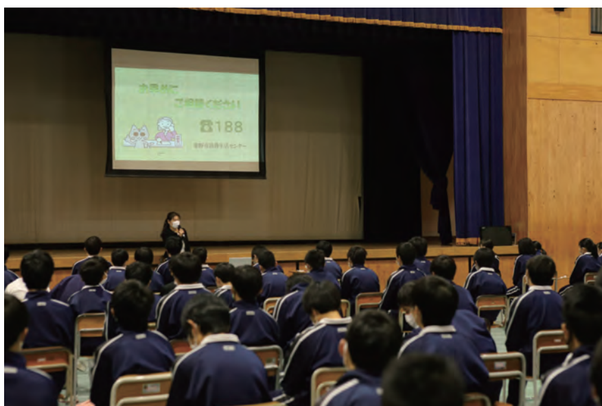
中学生消費者教室