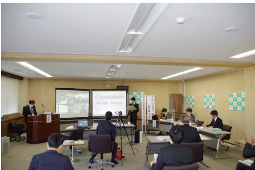
次世代育成アカデミー