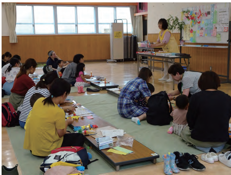
はだのこども館における自主事業の様子