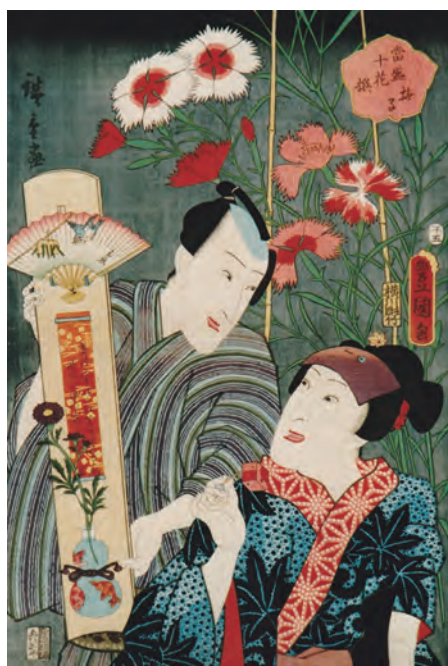
歌川国貞(三代豊国)・歌川広重『当盛十花撰 撫子』