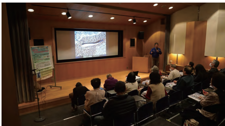
はだの生涯学習講座

※1 前田夕暮(まえだゆうぐれ)・・・明治16年に現在の秦野市南矢名に生まれた歌人。自然主義短歌の代表歌人の一人として注目され、後に自由律短歌の中心となるなど短歌史に足跡を残した