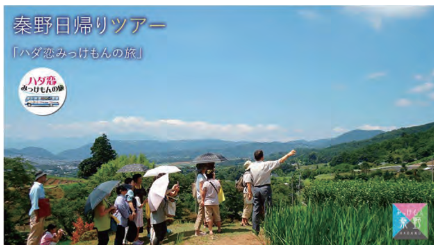
ハダ恋みっけもんの旅