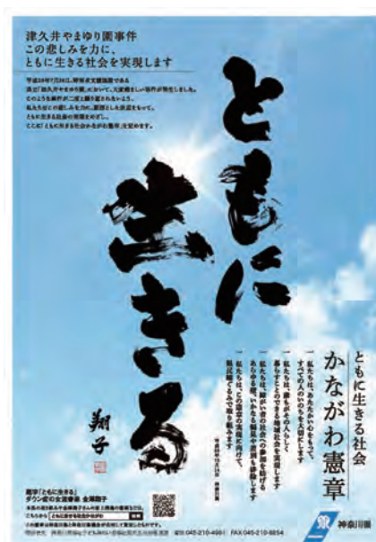
ともに生きる社会かながわ憲章ポスター

※1 農福連携・・・農業と福祉が連携し、障害者等の農業分野での活躍を通じて、農業経営の発展とともに、障害者等の自信や生きがいを創出し、社会参画を実現する取組み