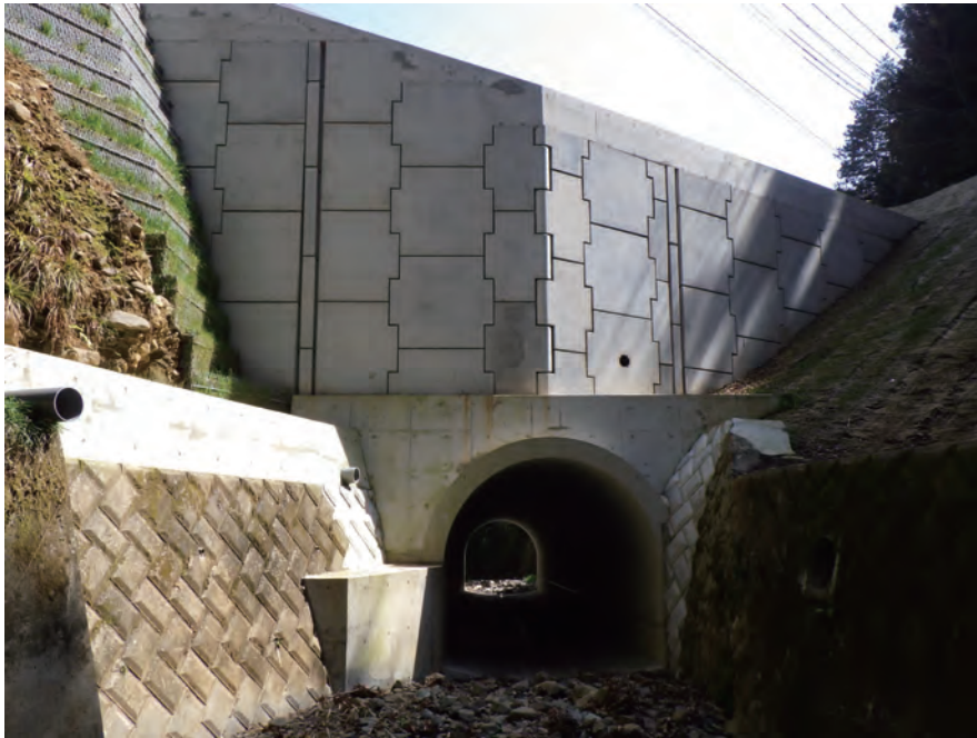
「市道 18 号線道路災害復旧工事」により復旧した護岸