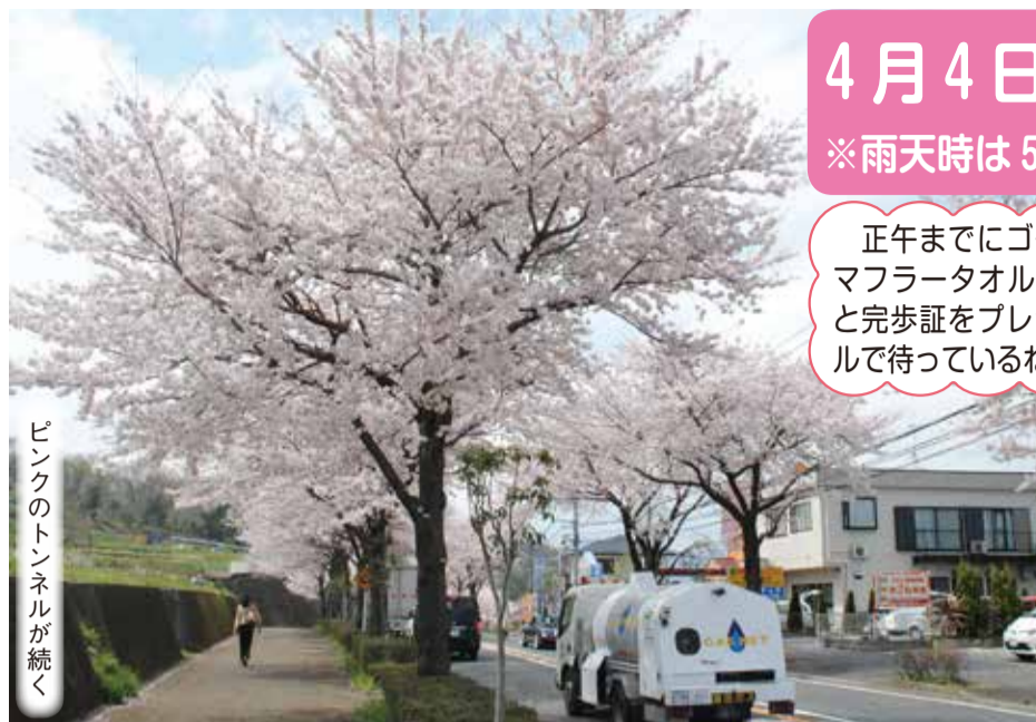
ピンクのトンネルが続く