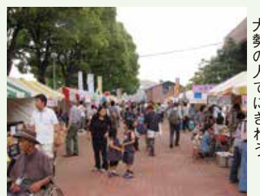
大勢の人でにぎわう

ところ 文化会館とその周辺 対象・費用 ◇市内で商工業を営む方 屋外8000円 屋内5000円 ◇フリーマーケット参加者 3000円 ※フリーマーケットは30店(申し込み多数のときは抽選) 申し込み 3月31日(月)までに商工まつり実行委員会(秦野商工会議所内) ☎(81)1355へ