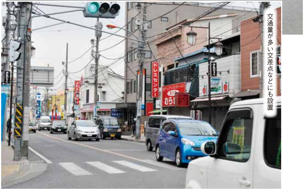
交通量が多い交差点などにも設置