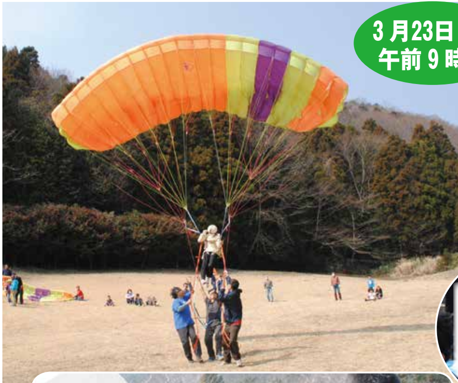
子供たちに大人気のパラグライダー体験(上)と丸太切り体験(右)