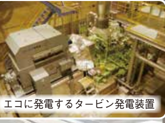
エコに発電するタービン発電装置

一般家庭約5千世帯の使用量に相当し、クリーンセンターの全ての電力を賄うだけでなく、余った分を電力会社に売るなど有効に活用しています。