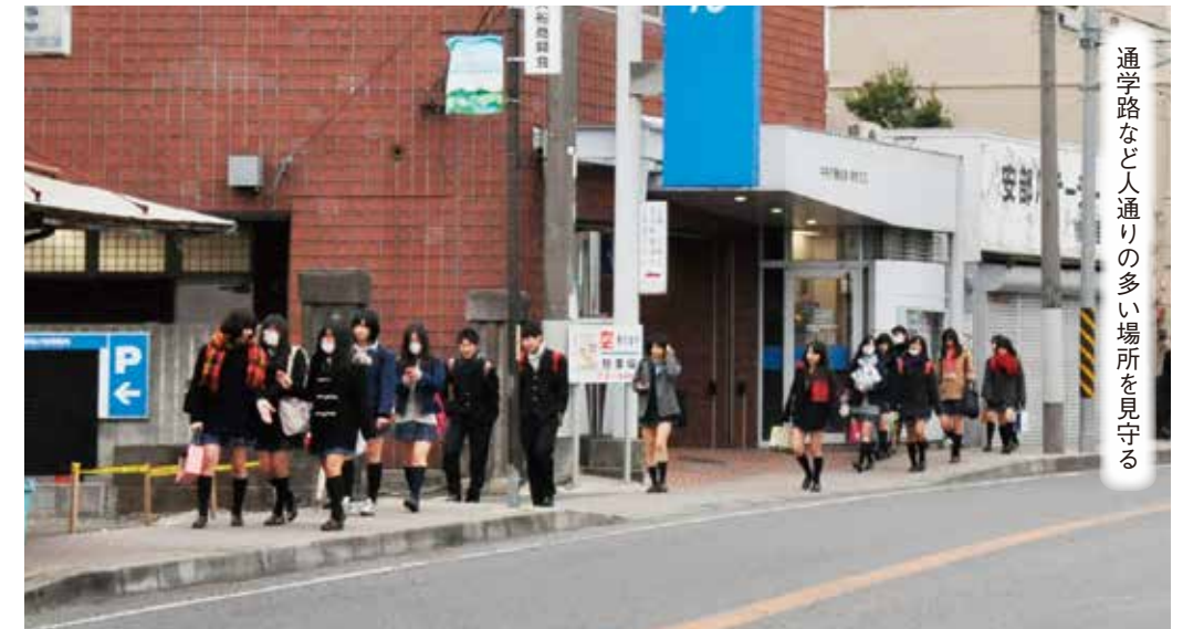
通学路など人通りの多い場所を見守る