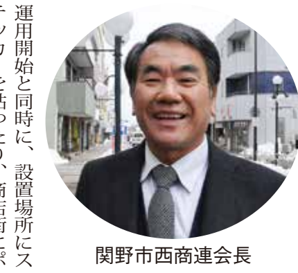
関野市西商連会長

「犯罪者はいつも恐怖心を抱いています。見られていないと感じていけません。見られていないと感じていけません。見られていないと感じていけません。見られていないと感じていけません。」