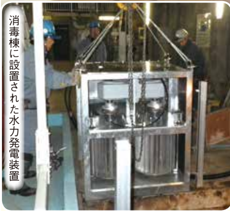
消毒棟に設置された水力発電装置