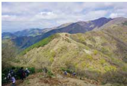
昨年の最優秀作品

「春の表丹沢」をテーマに、風景や動植物、秦野丹沢まつりの様子などを撮影した写真を募集します。最優秀作品は、来年の秦野丹沢まつりのポスターなどに使用します。