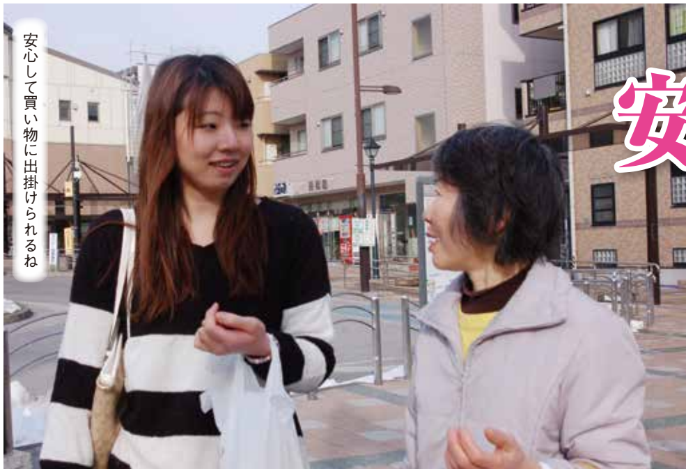
安心して買い物に出掛けられるね