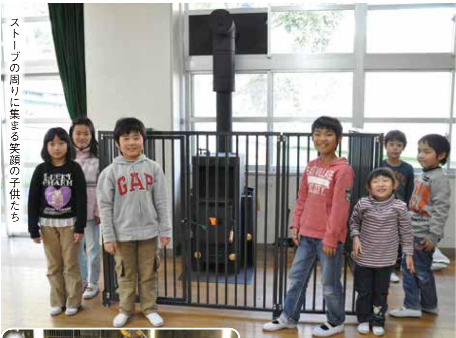
ストーブの周りに集まる笑顔の子供たち

また、本市の可燃ごみを焼却処理しているはだのクリーンセンターでは、焼却時に発生する熱を利用して、最大約3820キロワットを発電しています。これは