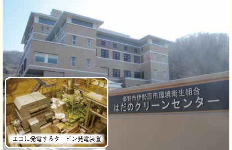
ごみの焼却熱を有効利用するクリーンセンター