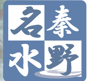
「秦野名水」のロゴマーク