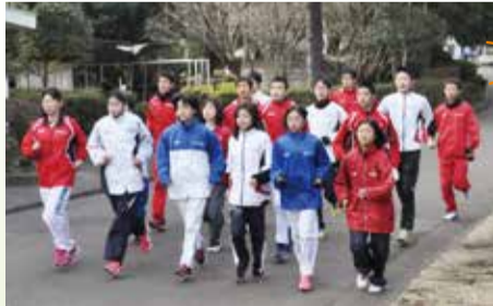
チーム一丸となって襷をつなぐ

午前九時にスタートし、一区の中学生選手が中央運動公園周回コースを走り、総合体育館前の第一中継所(午前九時九分ごろ)で二区の選手に襷をつなぎます。新町交差点から国道246号に入り、名古木交差点(九時二十分ごろ)を経て、新善波トンネルへと向かいます。