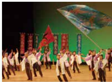
迫力あるステージが見もの

県人会相互の連携強化や文化交流を目的に毎年開催している県人会のつどい。6回目となる今回は、初舞台の京都同郷会などが、自慢の唄や踊りを披露します。