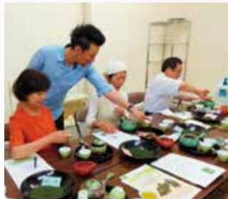
日本茶の風味を大切に

とき 2月17日(月) 午後2時～4時 ところ ギャラリー21(今川町1-2) 内容 日本茶の効用、入れ方、急須の選び方 定員 6人 費用 300円