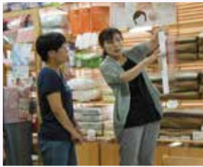
体に合った枕を選ぶ

とき 2月10日(月) 午後2時半～4時 ところ 渋沢百貨店(曲松1-1-8) 内容 睡眠の仕組みや正しい寝具の選び方 定員 5人