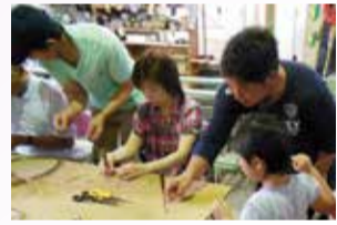
味わいのある作品を

とき 3月1日(土) 午前10時～正午 ところ 根倉畳店(入船町1-14) 内容 イグサを使ったストラップやミニチュアの畳作り 定員 10人 費用 500円