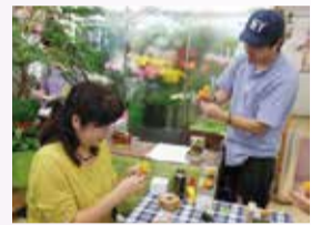
おひな様に花を添えよう

とき 2月19日(水) 午後1時～3時 ところ フローリストホワイト(今川町1-2) 定員 4人 費用 1500円