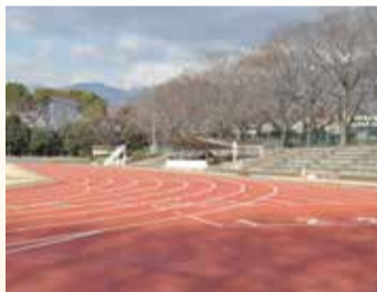
完成間近のトラック

昨年7月から改修工事を進めている中央運動公園陸上競技場。今月で工事が完了し、天候の影響を受けずに年間を通じて利用できる全天候型トラックへ生まれ変わります。