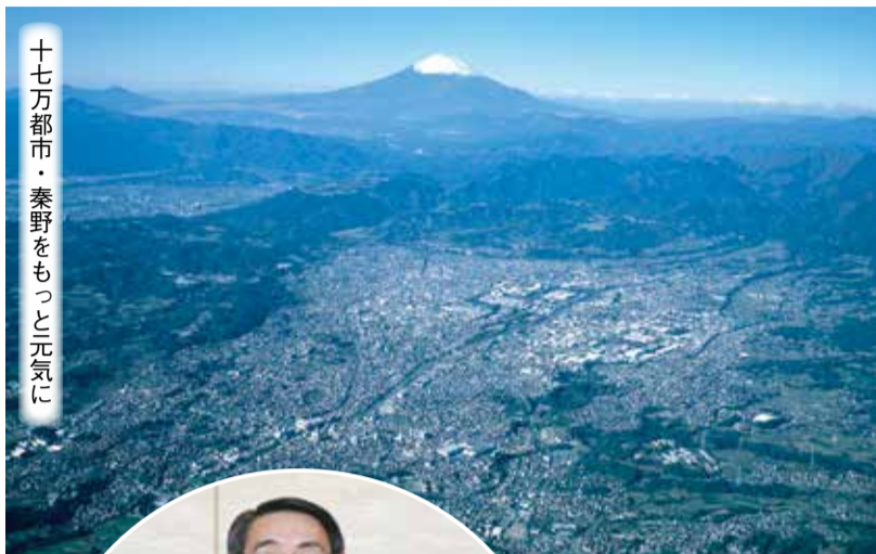
十七万都市・秦野をもっと元気に