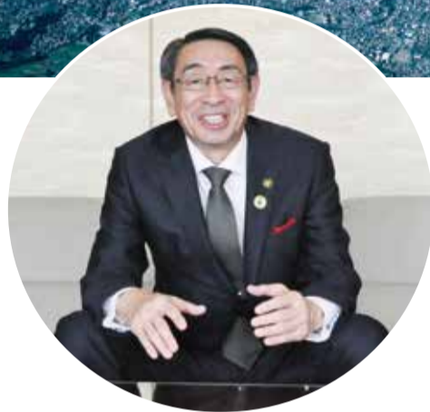
古谷 義幸 市長

任期満了に伴う秦野市長選挙が一月十九日に行われ、現職の古谷義幸氏が当選しました。引き続き市政を担う古谷市長が、三期目の抱負を語ります。