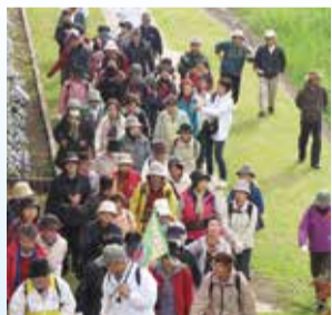
楽しく歩いて健康に

とき・ところ 3月1日(土)午前9時秦野駅北口まほろば大橋集合～中央運動公園陸上競技場～正午市役所 定員 150人(申し込み先着順)