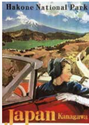
数多くの観光ポスターも手掛けた

油彩画からデザイン画・ポスターまで、幅広い作品を描き続けた宮永岳彦。「宮永岳彦が映した 現代と人々の心」をテーマに、多彩な作品約40点を紹介します。