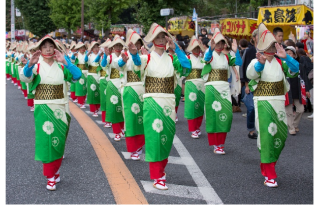
【たばこ音頭千人パレード】

昭和23年から市民の手で誇りを持って引き継がれてきた、本市最大の観光イベント「秦野たばこ祭」は、今年で69回目を迎えます。