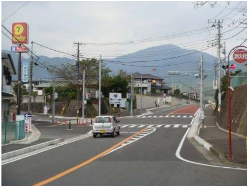
安全になった 県道70号交差点(寺山)