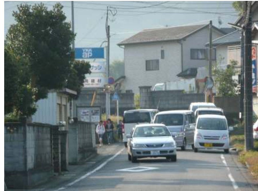
通勤時の裏道として朝夕の通行量が多い 市道61号(名古屋)