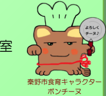
秦野市食育キャラクター ポンチーヌ