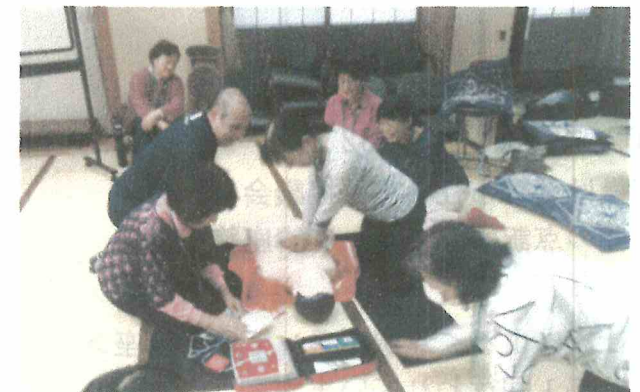
団員研修 AED の使用法