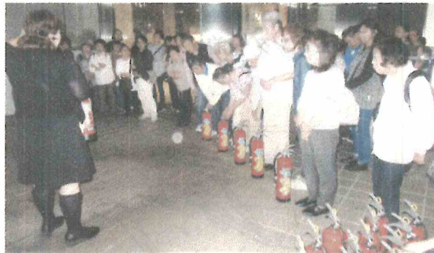
(視障者との交歓会)