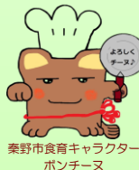
秦野市食育キャラクター ポンチーヌ