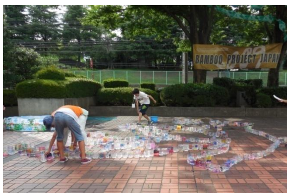
レイアウト図に沿ってキャンドルを設置する