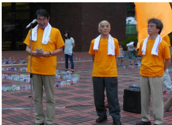
あいさつする古谷市長