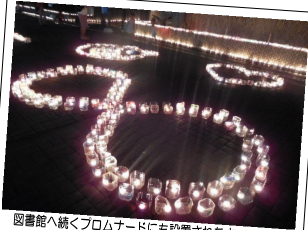
図書館へ続くプロムナードにも設置されたキャンドル