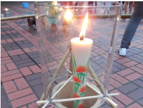
メインキャンドルには山形県の絵ろうそくを使用