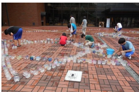
「平和」をイメージして、様々な形に並べられたキャンドル