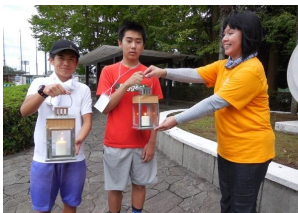
「平和の灯」をともすランタンを手渡される行進代表者