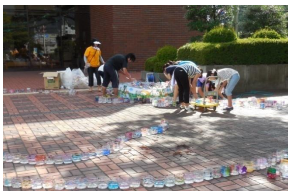
手分けしてキャンドルに水を入れていくサポーター

メイン会場となる文化会館に、イベントサポーターが集合。キャンドル設置についての説明を受けたあと、ボランティアリーダーの大学生の指示のもと、設置作業に取り掛かりました。