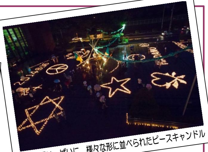
市民広場いっぱい、様々な形に並べられたピースキャンドル