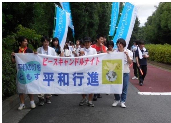
種火を先頭にメイン会場へ向かう平和行進