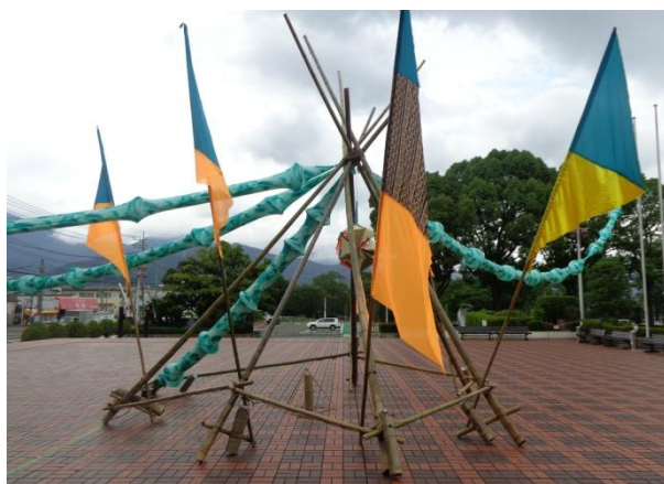
Bamboo Project Japan 製作の竹製オブジェ