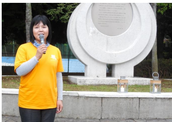
出発を前にあいさつをする桐生副実行委員長