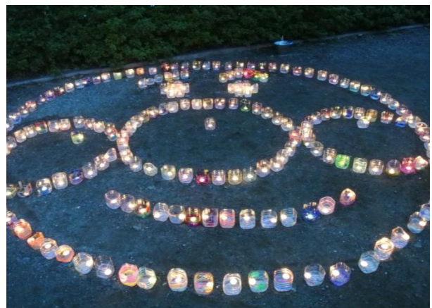
つまき北公園に設置されたピースキャンドルと点灯に参加する来場者