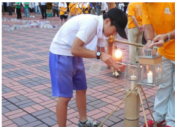
行進参加者代表がオブジェ中央のメインキャンドルに点火