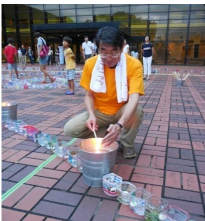
メインキャンドルから採火した火を周りのサブキャンドルに点火