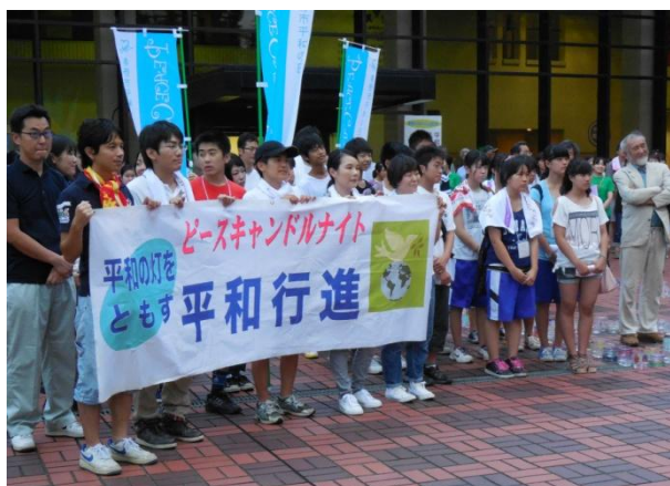
平和行進が文化会館に到着

そして、サブキャンドルの火を使って、イベントサポーターや来場者が協力して、会場に設置した約 10,000 個のピースキャンドルに火をともしました。