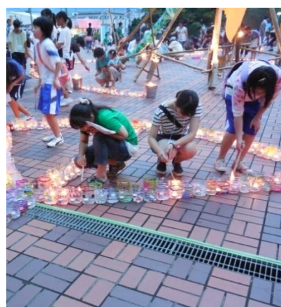
サポーター、来場者も点火に参加