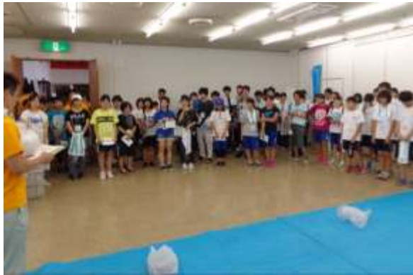
ガイダンスを聞くサポーター

メイン会場となる文化会館に、イベントサポーターが集合。キャンドル設置についての説明を受けたあと、ボランティアリーダーの大学生の指示のもと、設置作業に取り掛かりました。