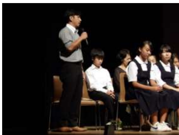
平和を考えるパネルディスカッションでは、コーディネーターの質問に、親御さんたちが生の声で答える場面も