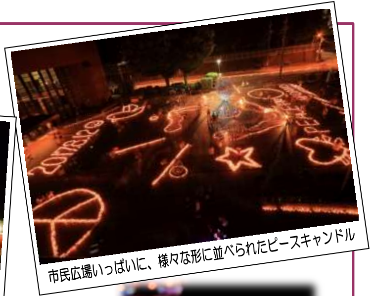
市民広場いっぱい、様々な形に並べられたピースキャンドル