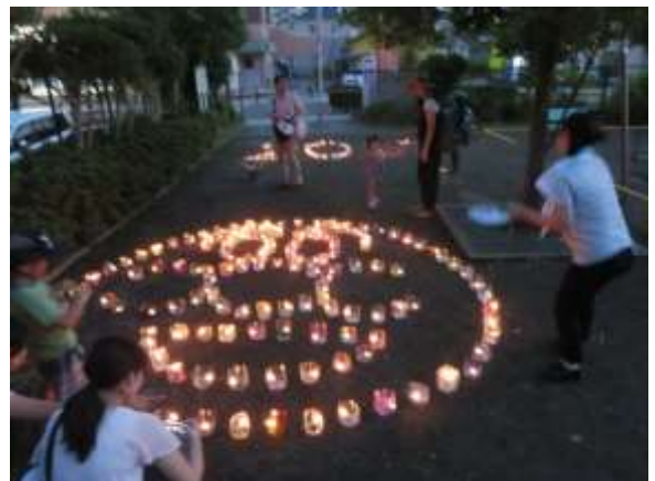
つまき北公園に設置されたピースキャンドルと点灯に参加する来場者