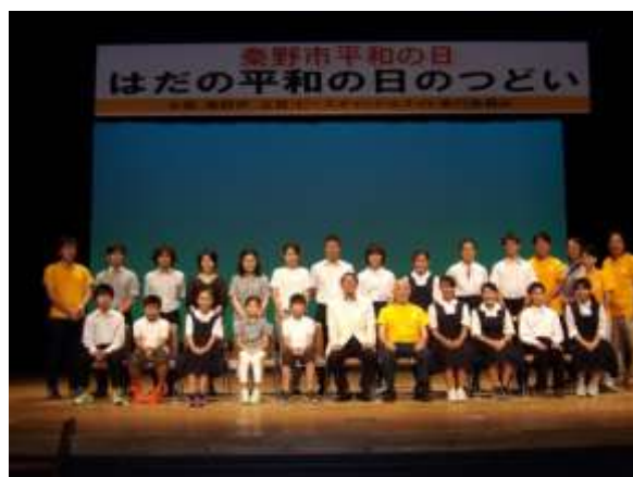
最後に全員で記念撮影