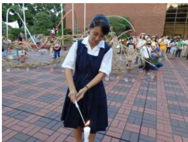
行進参加者代表がオブジェ中央のメインキャンドルに点火