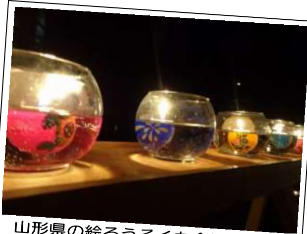
山形県の絵ろうそくも会場を演出