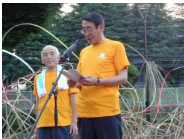
あいさつする古谷市長