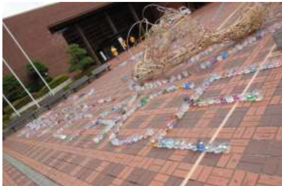
「平和」をイメージして、様々な形に並べられたキャンドル