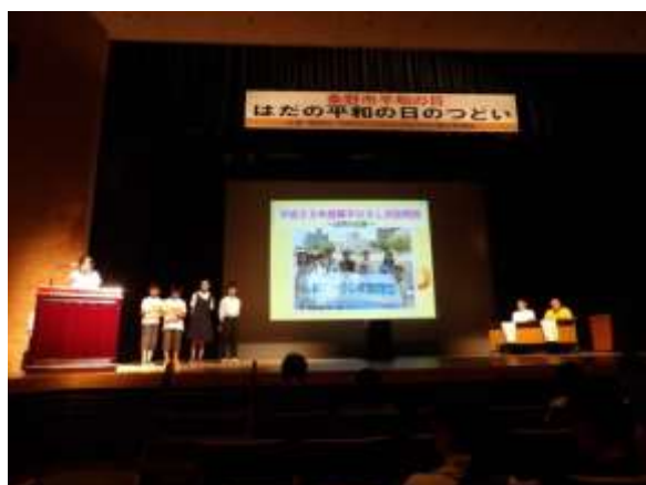
親子ひろしま訪問団は、こどもたち5人が、スライドに合わせ活動報告