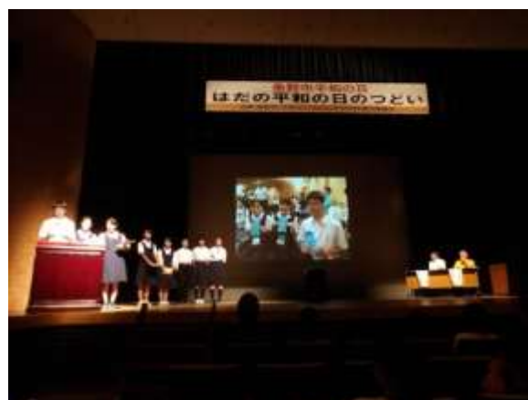
中学生ながさき訪問団は、タブレット端末を操作しながら活動報告