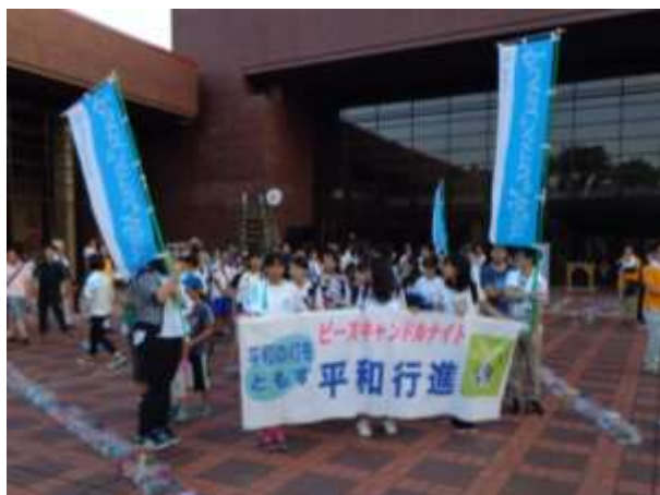
平和行進が文化会館に到着

そして、サブキャンドルの火を使って、イベントサポーターや来場者が協力して、会場に設置した約 10,000 個のピースキャンドルに火をともしました。