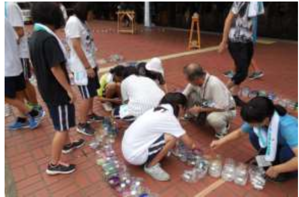
レイアウト図に沿ってキャンドルを設置する