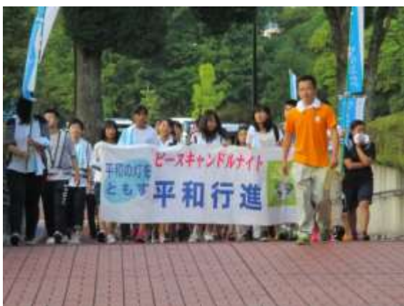
種火を先頭にメイン会場へ向かう平和行進