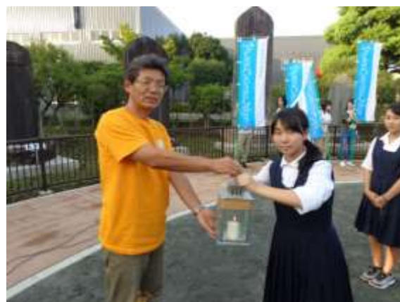
「平和の灯」をともすランタンを手渡される行進代表者