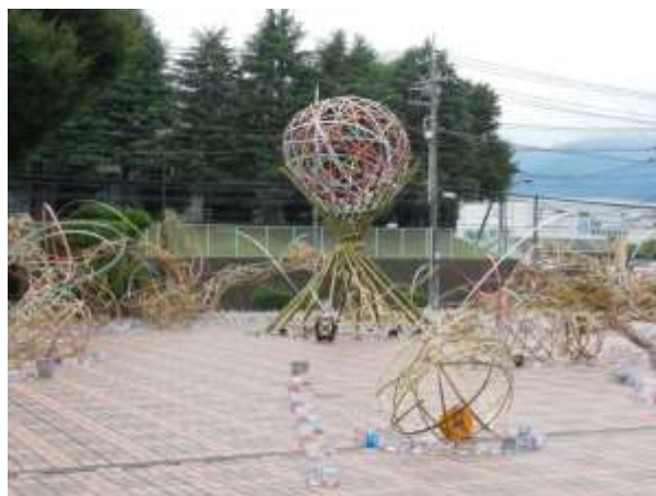
Bamboo Project Japan 製作の竹製オブジェ