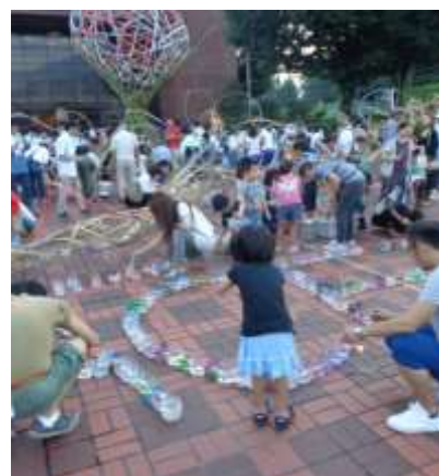
サポーター、来場者も点火に参加