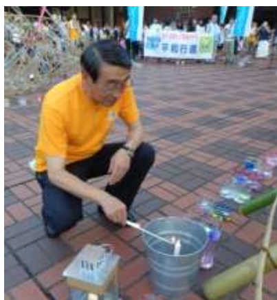
メインキャンドルから採火した火を周りのサブキャンドルに点火