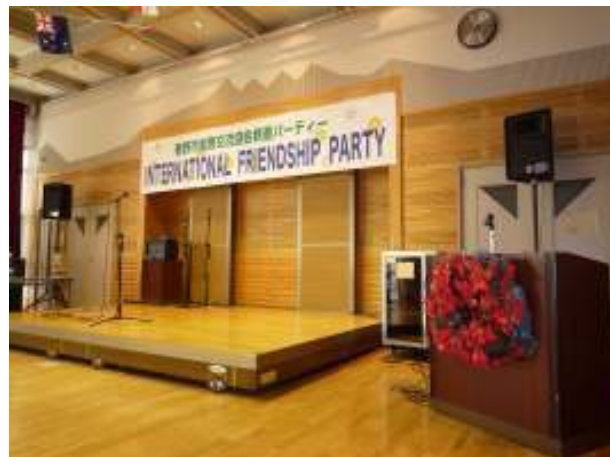
ステージと司会席