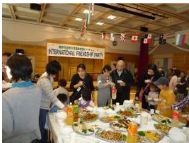
料理を楽しみながら交流 を深める参加者たち