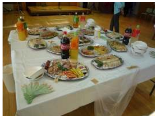
各テーブルの飲食物