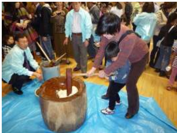
親子が積極的に参加して、 子どもにもちつきを体験させた。