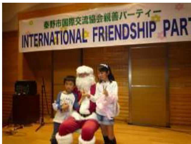
最後は、サンタクロースと 記念撮影！