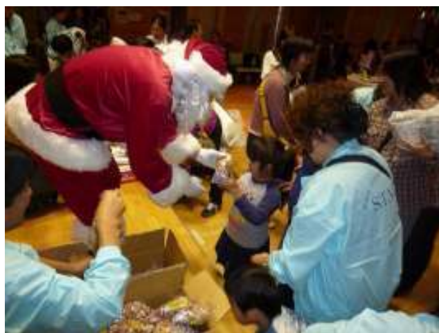
抽選会で当たらなかった子どもたちには、 サンタクロースが一人ひとりに 残念賞のお菓子を配った。