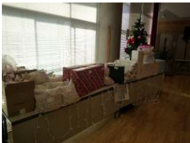
クリスマスツリーの前に 並べた景品計50点