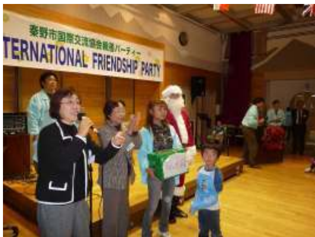
クリスマスプレゼント抽選会で、 サンタクロースから景品が渡された。