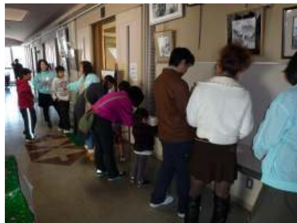
受付後、ネームプレートの作成と 抽選券の作成をする参加者