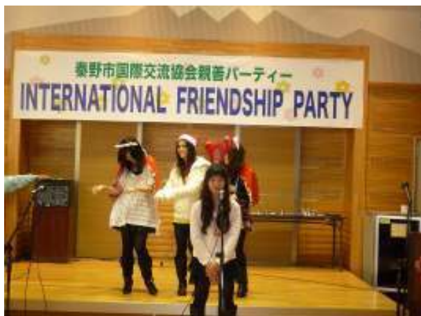
本町中学校日本語教室生徒が 各国の言語によるクリスマスソングとダンスを披露。