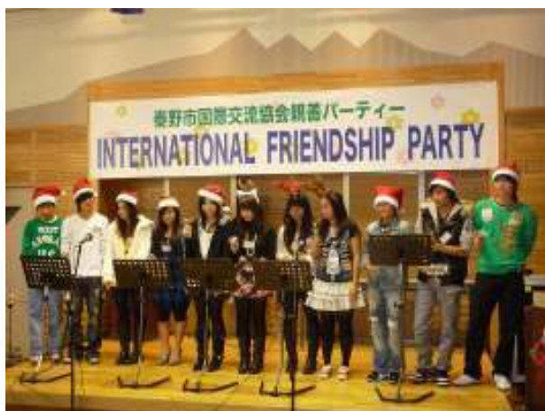
本町中学校日本語教室生徒 によるハンドベルの演奏