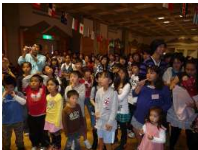
ステージ前に集まる参加者たち