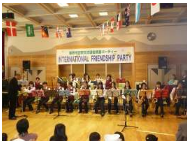
中高生ビッグバンドによるジャズの演奏。 音楽に合わせて踊りだす南米系の外国籍市民も見受けられた。