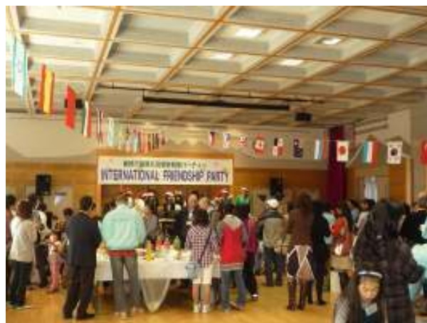
開会後の 会場全体写真