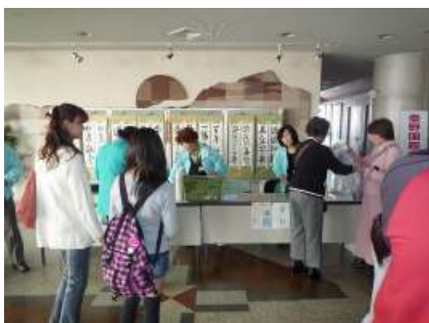
大会議室前で受付