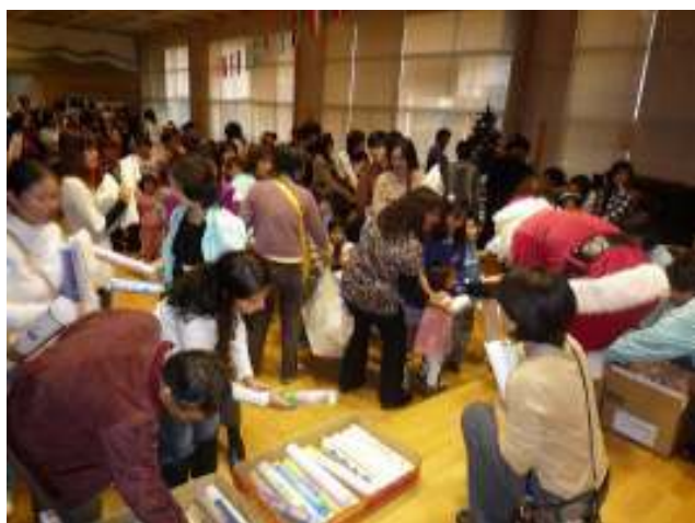
大人たちには残念賞として、 カレンダーをプレゼント。