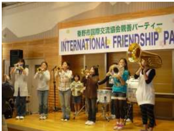
ラッパ隊による オープニング演奏