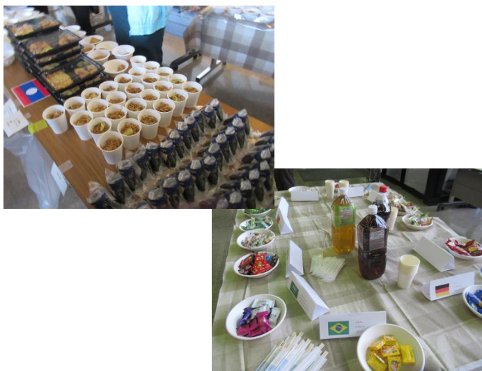
振る舞われた料理・お菓子