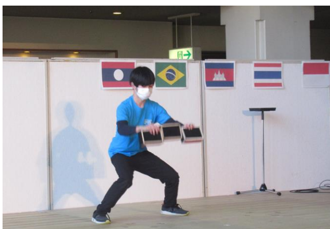
東海大学生によるジャグリング発表