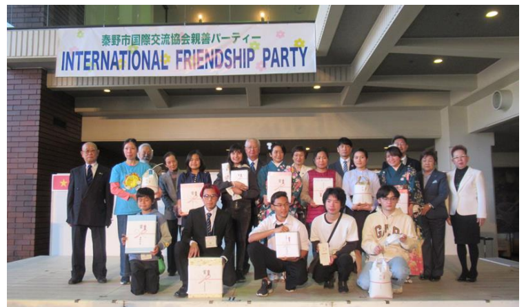
最後は、参加者で記念撮影