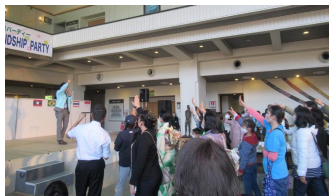
最後は恒例のじゃんけん大会