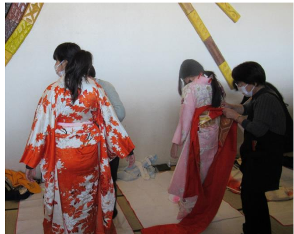
着付体験コーナー