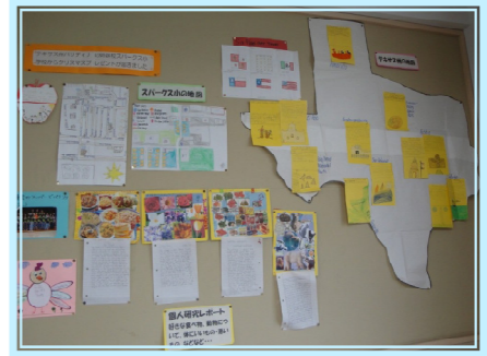
海の向こうへと誘う 校内のパサデナコーナー

今年も学校行事に追われる日々と思いますが、「海の向こうに届けよう(秦野市の紹介・自校のPR・私たちの姉妹校への思い)」を、子供たちがもっともっと心に響かせて準備・作業し、作品を送り出すまでを、友好協会としてサポートしていきたいと考えています。つまり、子供たち自身がこの提携のすばらしさを理解できるよう、また、後輩にそのすばらしさが引き継がれることを願い、交流促進を支援していきたいと役員一同意を燃やしています。