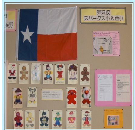
届いた作品は異文化を学ぶ もう一つの教科書

一昨年西小を訪問した折、タイムリーに小学校における英語授業の教室を見せていただきました。そこで、教育視覚教材の準備に並々ならぬ努力をされていることを知りました。そして、パサデナからの贈り物が展示されているのを見た瞬間「そうだ!! 私たちはパサデナの人々を家庭に招き交流を深めて欲しい。交流を受けた方々の家には、もう充分に楽しませてもらったパサデナグッズがきっとある」と思い付きました。そこで、今年の総会でこの話をしたところ、段ボール2箱ほどのグッズが集まりました。私たちはそれらを3校に分け各学校へ届けました。“目で見て、触って異文化を感じる心”を今後も繋げていきたいと考えています。