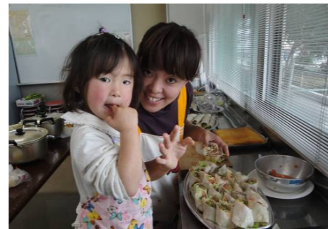
最年少の参加者もお手伝い