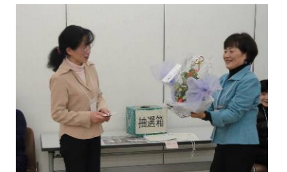
ストロベリー・フェスティバル賞の賞品は、イチゴの鉢植えでした!