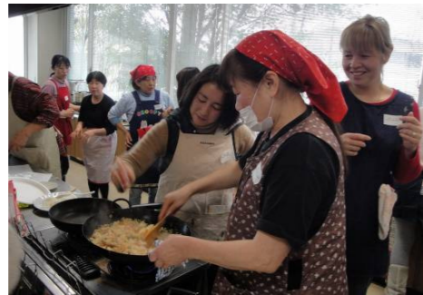
段々と息が合ってくる参加者の皆さん