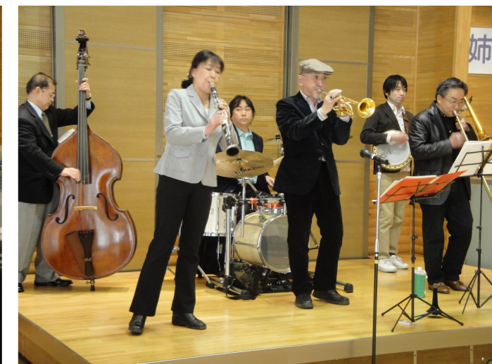
会場を盛り上げたハマトラジャズ倶楽部のジャズ演奏

2012年2月5日(日)、パサデナ姉妹都市交流促進フォーラム「英語で世界とつながろう」が開催されました。昨年は、東日本大震災が発生した影響により開催中止となったため、2年振りの姉妹都市フォーラム開催となりました。