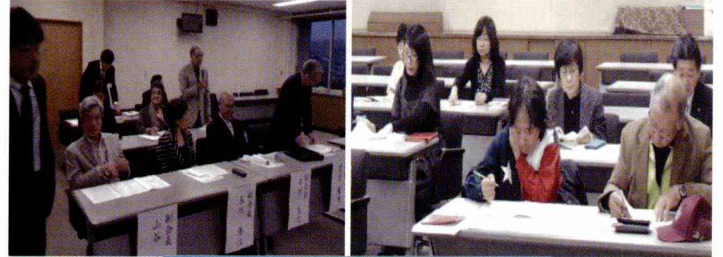
様々な検討がされた総会

会長、抱負を述べる パサデナとの交流で学んだ大切なことは、国際交流はテクニックやスキルではなく、思いやりを根底にした心の交流ということです。これからも、パサデナの人、会員同士のつながりを大切に頑張りたいと思います。