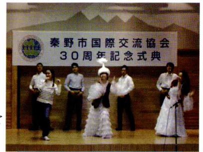
カザフスタンの伝統的な踊り

秦野市国際交流協会は、秦野市に住む外国人と秦野市民との交流を通し国際親善と国際理解を図ることを目的に、1985（昭和60）年に国際交流懇談会として設立されました。2005（平成17）年には、より幅広い活動を展開するため名称を「秦野市国際交流協会」とし、今年度で31年を迎えました。