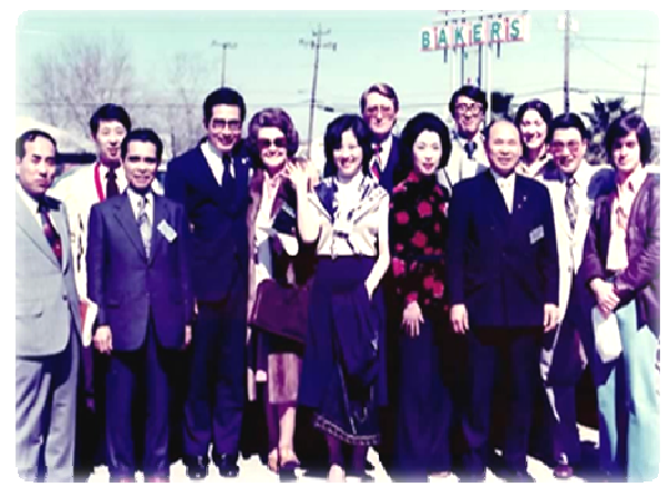
秦野から初めて、市民13名が訪問