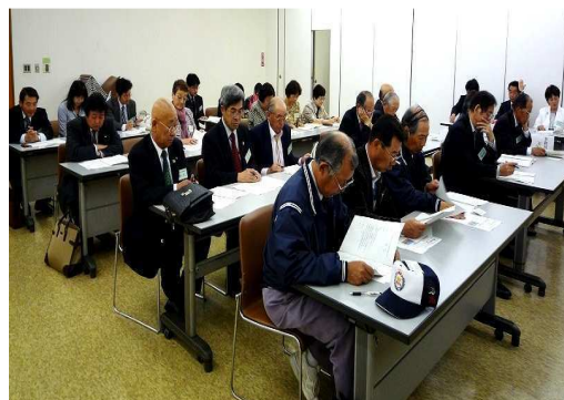
より活発な交流を話し合う総会