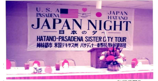
遠き日を彷彿させる横断幕