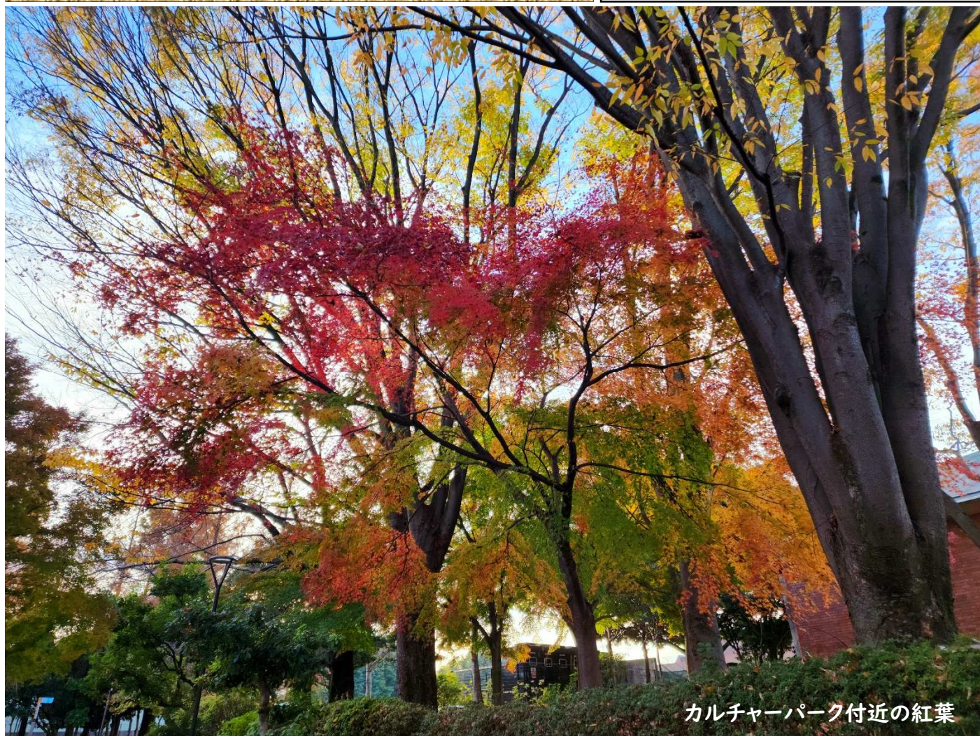
カルチャーパーク付近の紅葉

晩秋の紅葉を眺めながら、窓辺で読書に耽 ふけ る。そして南公民館では恒例の公民館まつりが開催されます。例年の作品展示、舞台発表に加えて、今年は模擬店も開催され賑やかになるでしょう。まつりの後はクリスマス、年末、新年へと師走のあわただしさの中で時が過ぎて行きます。