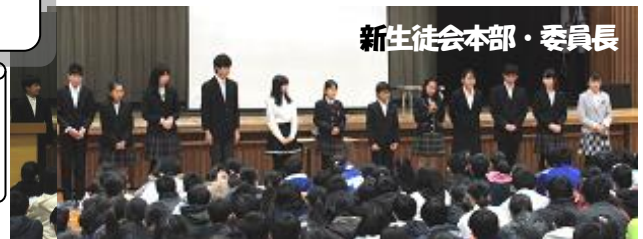
新生徒会本部・委員長

みんなの力で「ありがとうと笑顔のあふれる」 より良い南が丘中学校を創っていきましょう。 これからも、ご協力、よろしくお願いします。