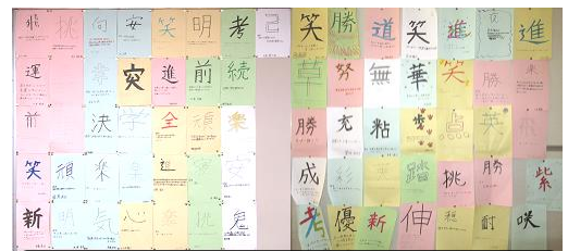
3年生新年の思いを漢字一文字で・・・

9月から各自でテーマ設定の準備をし、「課題追求学習」に取り組んできました。その一部を掲示してあります。1/30 2/3に代表者による発表が行われました。