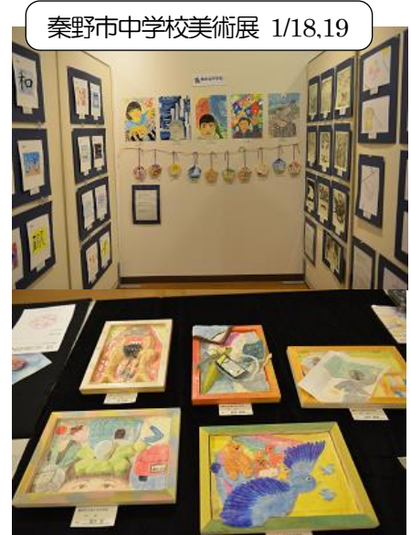
秦野市中学校美術展 1/18,19

サンキッズ南が丘こどもえんで、園児とお弁当を一緒に食べたり、園庭で遊んだり、貴重なふれあい体験ができました。園児たちの純粋な姿から、たくさん学びました。