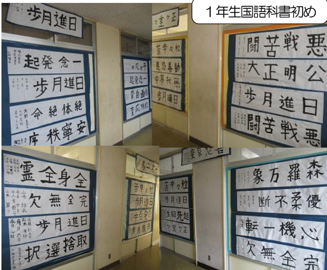
1年生国語科書初め