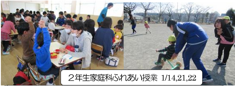
2年生家庭科ふれあい授業 1/14,21,22

サンキッズ南が丘こどもえんで、園児とお弁当を一緒に食べたり、園庭で遊んだり、貴重なふれあい体験ができました。園児たちの純粋な姿から、たくさん学びました。