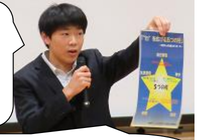
いじめを考える児童生徒委員会