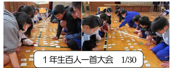
1年生百人一首大会 1/30

3学期始めの授業で4人グループによる4字熟語の書初めをしました。新年の抱負を表す熟語を選んで一人一文字ずつ書きました。