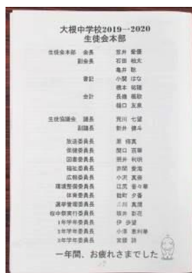
本部・委員長一覧

1・2年生は4月に新入生を迎え、1つずつ学年が上がります。そして、生徒会活動や部活動、桜中祭で動かしてもらった側から動かしていく側へと変わっていきます。