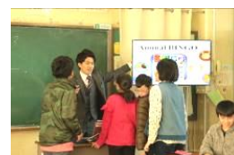
授業後も質問攻めでした

PTA総会 (14:30~15:30) & 1・2年学年総会 (P総会終了後) 1月24日火曜日に開催します。気をつけてお越し下さい。