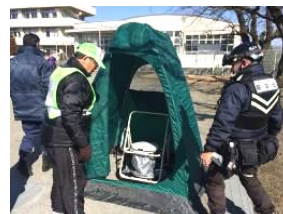
ホ口付きのWCを設置