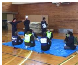
シートを敷いても床が堅い

大地震発生後すぐには避難所に入れないこと、けがや病気・要配慮者などへの対応、保健衛生上の問題など多くの話題があがりました。第一次避難場所の確認や自治会からの情報など、普段からの心構えと準備をお進め下さい。