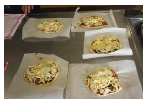
これから焼きますよ～

さて、学校もいよいよ今年度の最終ステージへ。あすなる級では、2月7日金曜日午前中作ったピザで昼食会とレクを行い、思い出を一つ増やしました。3年生は18日火曜日から卒業期の特別プログラムに入っています。仲間との残り少ない時間を大切に過ごしてほしいですし、1・2年生も4月からの新たなステージを見据え、まとめの期間を中味濃く過ごしてほしいです。ご家庭でも夢に向かって話が弾むことを願っています。