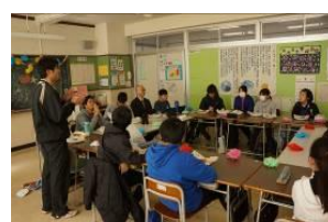
楽しい会食 いただきまーす