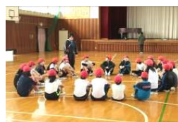
緊張はどちらかな？

中学入学への不安が少しでも減ることを願って、中学の教員が19・20日に広畑小と大根小にお邪魔して授業を行いました。普段以上の素敵な笑顔の中学校教員を楽しんでもらえていたら嬉しいです。いかがだったでしょうね？